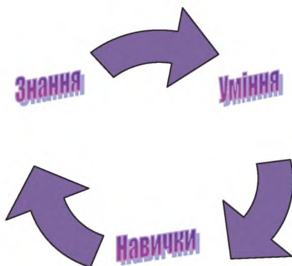
Рис. 2. Складові поняття «термінологічна компетентність»

Термінологічна компетентність виражає значення традиційної тріади «знання–уміння–навички», інтегруючи їх у єдиний комплекс (рис. 2). Цей аспект має важливе значення, оскільки сприяє цілісній підготовці фахівців бібліотечної галузі, розвиває їхню професійну культуру, комунікативну компетентність.