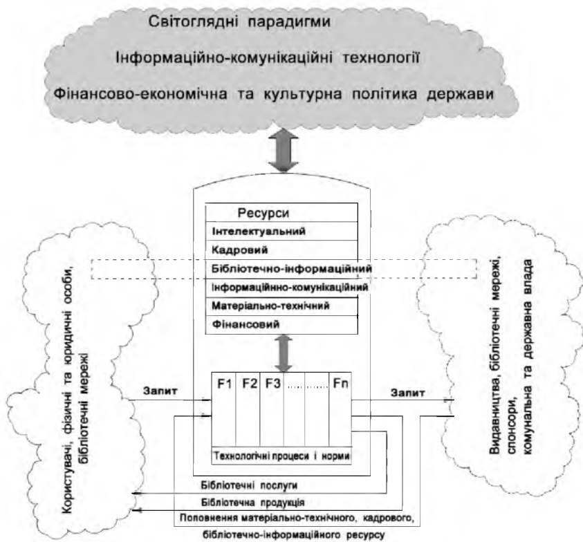
Рис. 1. Концептуальна модель бібліотеки

ми керівництва бібліотекою. У ході реалізації вищезазначеного процесу залучаються кадрові, інтелектуальні, бібліотечно-інформаційні, інформаційно-комунікаційні, матеріально-технічні й фінансові ресурси. У результаті ті, хто ініціював запити, одержують бібліотечні послуги й продукти. Користувачами бібліотеки є як фізичні, так і юридичні особи. Бібліотечно-інформаційна продукція є результатом когнітивної діяльності бібліотек, який може бути представлений: бібліографічними покажчиками різних видів, реферативною та аналітико-синтетичною інформацією, даними бібліометричної, наукометричної й прогностичної діяльності. Можливості бібліотек обмежені й тому вимагають постійного вдосконалення та поповнення. З метою поглибленого формування власних ресурсів бібліотека звертається із запитом до своїх засновників, видавництв, наукових установ і навчальних закладів, органів державної й комунальної влади, спонсорів та інших.